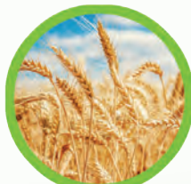
Agrar & Ernährung