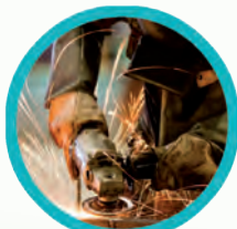
Stahl & NE-Metalle